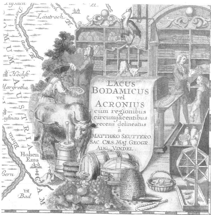
Bodenseekarte (détail), 1540 © George Seutter.